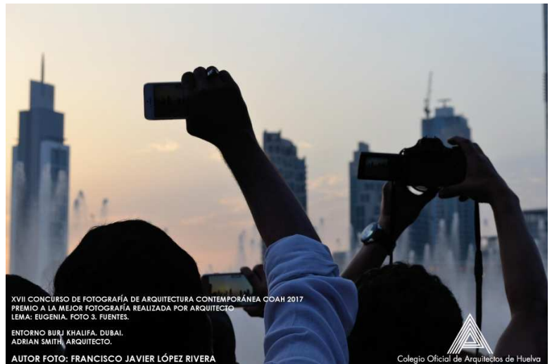
XVII CONCURSO DE FOTOGRAFÍA DE ARQUITECTURA CONTEMPORÁNEA COAH 2017 PREMIO A LA MEJOR FOTOGRAFÍA REALIZADA POR ARQUITECTO LEMA: EUGENIA. FOTO 3. FUENTES. ENTORNO BURJ KHALIFA. DUBAI. ADRIAN SMITH, ARQUITECTO.

PUEDES ENCONTRAR LAS BASES COMPLETAS DEL CONCURSO AQUÍ